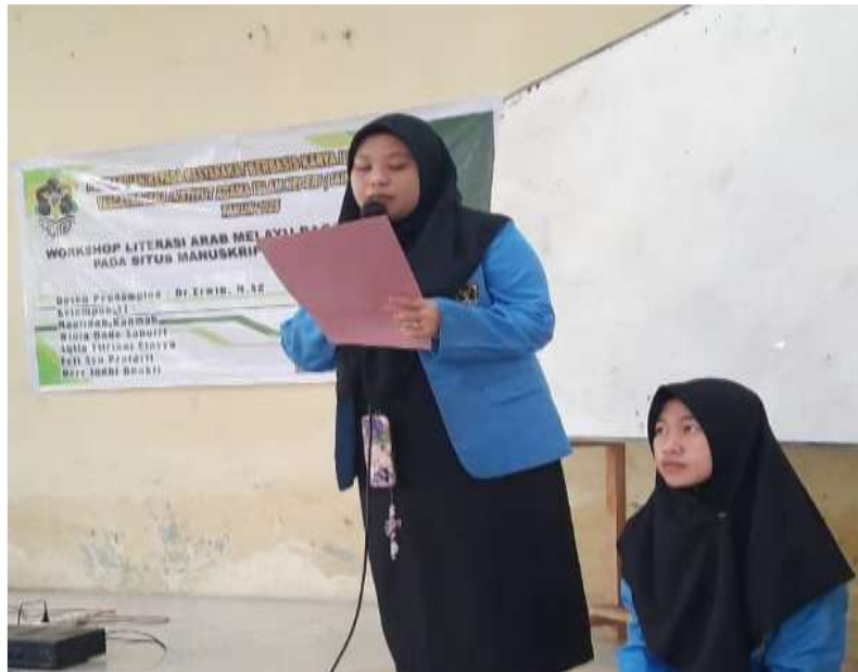
Gambar 2. Sambutan dari Mahasiswa Perwakilan tim PKM