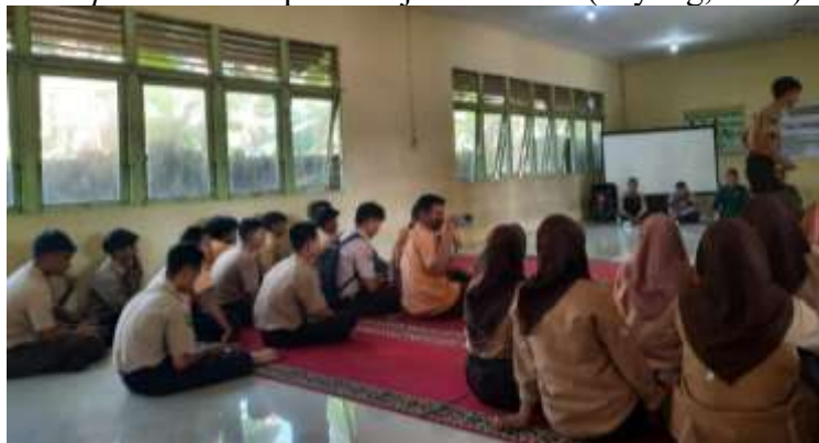
Gambar 4. Siswa Berperan Aktif dalam Praktek Membaca Aksara Arab Melayu

Selama praktik berlangsung, tim PKM memberikan pendampingan secara langsung untuk memastikan bahwa setiap siswa memahami cara mengenali bentuk huruf, menggabungkan suku kata, serta melafalkan bunyi-bunyi yang khas dalam aksara Arab Melayu. Pendampingan bersifat scaffolding , yaitu memberikan bantuan yang bertahap hingga siswa mampu membaca secara lebih mandiri sesuai teori Konstruktivisme Vygotsky tentang zone of proximal development dalam pembelajaran literasi (Payong, 2020).