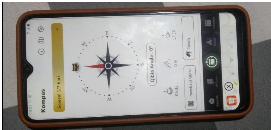
Gambar 2. Mencari arah Utara