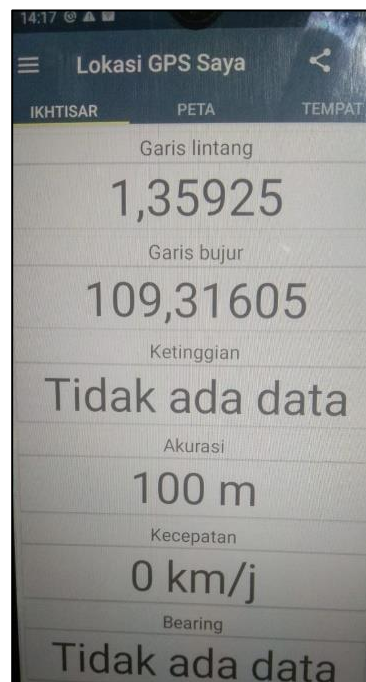
Gambar 1. Data lintang tempat dan bujur tempat

Sebelum pelaksanaan pengukuran, beberapa langkah persiapan dilakukan untuk memastikan kelancaran kegiatan. Langkah pertama adalah memperoleh persetujuan dari subjek proyek, yaitu keluarga saya dan tokoh masyarakat setempat, untuk melakukan pengukuran arah kiblat di lokasi. Selanjutnya, dilakukan pengambilan koordinat geografis (lintang dan bujur) rumah menggunakan aplikasi GPS di smartphone. Data ini menjadi acuan dalam perhitungan arah kiblat menggunakan rumus trigonometri segitiga siku-siku. Selain itu, dibuat segitiga siku-siku sederhana untuk membantu visualisasi sudut kiblat berdasarkan hasil perhitungan. Semua peralatan, termasuk kompas magnetis, aplikasi kompas kiblat, dan alat ukur seperti penggaris dan tali, juga disiapkan.