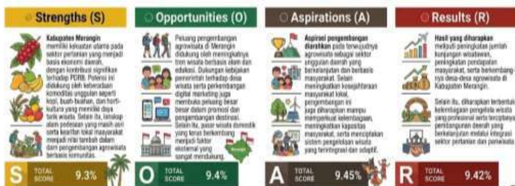
Gambar 6. Pengembangan Model SOAR

Berdasarkan hasil analisis SOAR, seluruh komponen menunjukkan nilai yang tinggi, yaitu Strengths (9,3), Opportunities (9,4), Aspirations (9,45), dan Results (9,42), yang mengindikasikan bahwa Kabupaten Merangin memiliki potensi yang sangat kuat dalam pengembangan agrowisata. Kekuatan internal didukung oleh dominasi sektor pertanian, komoditas unggulan, lanskap alam, serta kearifan lokal, sementara peluang eksternal diperkuat oleh tren wisata yang meningkat, dukungan pemerintah, pemasaran digital, dan pasar domestik yang luas. Selain itu, aspirasi pengembangan menekankan pada penciptaan destinasi unggulan, peningkatan kesejahteraan masyarakat, wisata berkelanjutan, serta pemberdayaan komunitas. Hal ini selaras dengan hasil yang diharapkan, seperti peningkatan jumlah wisatawan, pendapatan, status desa wisata, dan penguatan kelembagaan lokal. Namun demikian, hasil penilaian ini masih perlu didukung oleh penyajian data primer yang lebih rinci dari wawancara dan FGD agar validitas dan kekuatan analisis semakin terjamin.