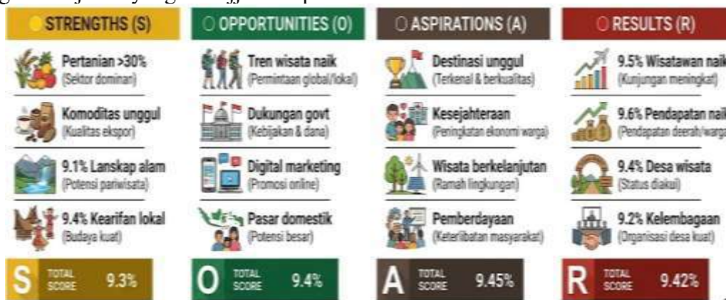
Gambar 5. Model SOAR

tersedia sangat mendukung pengembangan agrowisata, baik dari sisi tren wisata maupun dukungan kebijakan yang ditunjukkan pada Gambar 5.